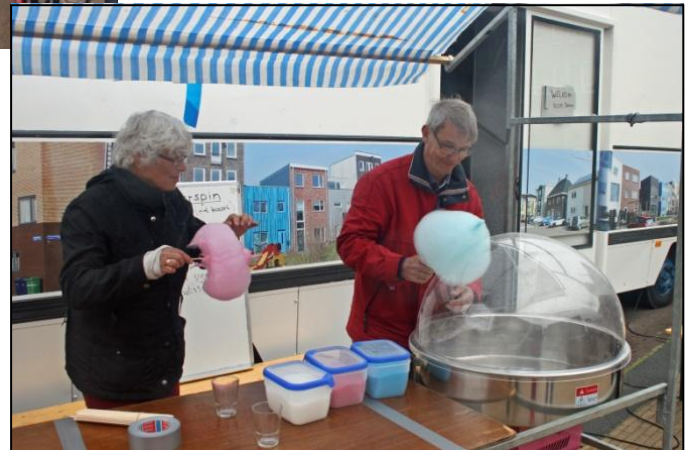
Soms is pionieren suikerspinnen draaien

Twee weken na Pasen, op zaterdag 10 mei, stond de Kerk op Wielen op het "Poort Sociaal Festival". Dat festival was een initiatief van Woonmere en InteraktContour. Deze organisaties hebben in een gebouw aan de Europalaan twee woongroepen voor mensen met een hersenletsel. De bewoners willen graag meer contact met de buurt. Het "Poort Sociaal Festival" moet de integratie met de buurt bevorderen.