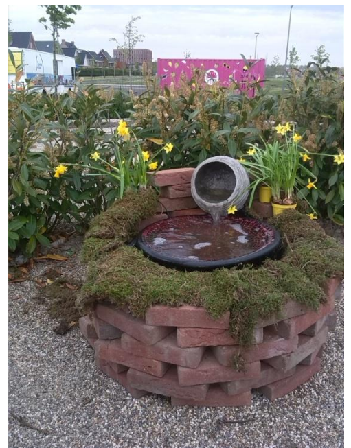
Paasen: Bron van Leven

Voor de volwassenen was er de mogelijkheid om het Paaslabyrint te wandelen. Wandelend naar het centrum van het labyrint kwam je langs zeven symbolen die uitnodigden om te mediteren over de betekenis van het lijden van Christus. In het hart van het labyrint was een bron gemaakt als symbool van de Opstanding en het nieuwe leven. Woensdagmiddag kwamen 45 kinderen naar de bus om een Palmpaasstok te maken. In de flyer stond ook dat er een Paasmand kon worden besteld om familie, vrienden of burens te verrassen. Van die mogelijkheid maakten maar een paar mensen gebruik, maar zij bereikten met die Paasmand wel wat onze bedoeling was: iemand een mooie Paasverrassing bezorgen. Al met al was het heel goed om in deze Goede Week voor Pasen voor het eerst in actie te zijn met de Kerk op Wielen. Er kwam geen grote menigte mensen op af. Dat hadden we ook niet verwacht. Maar de reacties van de mensen die wel kwamen, waren heel positief. Het meest bijzonder waren misschien wel de reacties van de mensen die nieuwsgierig naar onze opvallende bus toekwamen en verrast ontdekten dat het om de kerk ging. We hadden een paar mooie ontmoetingen, met soms heel diepgaande gesprekken.