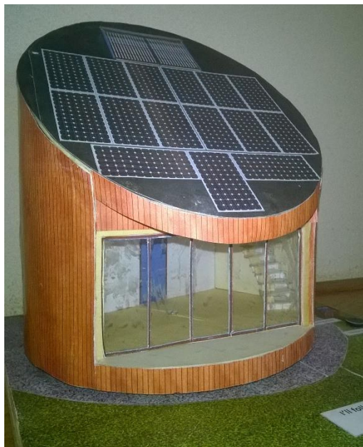
Figuur 2 De Maquette van de "Tiny Church"

We zijn nog steeds erg blij met de "Kerk op Wielen". Daarmee kun je echt kerk in de buurt zijn. Maar de omgebouwde SRV-wagen heeft ook z'n nadelen. In de winter is het er te koud, er kunnen maximaal vijftien mensen een plek vinden en er moet een vergunning zijn om hem ergens te parkeren. Vandaar dat we voor het Kerkcafé zijn uitgeweken naar de Sterrenschool. Ruimte genoeg en laagdrempelig. Maar we missen er de gezelligheid van de huiskamer. En we hebben het gevoel dat we in de Sterrenschool een beetje schuilgaan. Want met "de Kerk op Wielen" zijn we duidelijk herkenbaar aanwezig in Poort. Onverwacht boodt zich een heel nieuwe mogelijkheid aan.