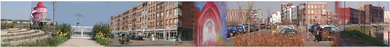
De Schone Poort